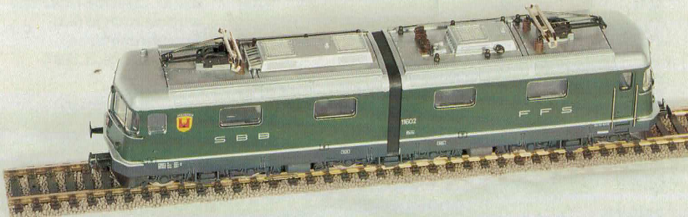
Nr. 200/201 Re 6/6 Prototyp-Ausführung 2teilig Auch dieses sehr bewährte und Zugkräftige HAG-Modell wird nicht mehr produziert.

Achtung! Als krönender Abschluss wird eine begrenzte Anzahl dieser Lok noch in roter Lackierung und mit Motor Typ 88 ausgeliefert. Reservieren Sie diese Rarität rechtzeitig!