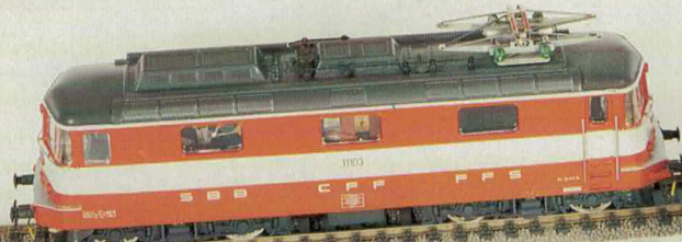
Nr. 210 Wechselstrom Nr. 211 Gleichstrom Swiss Express Re 4/4 II