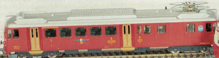
Nr. 260/261 MO-Triebwagen Nr. 402/403 MO-Personenwagen 2. Klasse Nr. 475/476 MO-Steuerwagen Auch als Set erhältlich