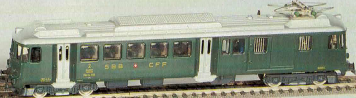
Nr. 150 Wechselstrom Nr. 151 Gleichstrom SBB-Triebwagen