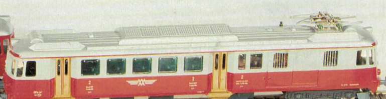
Nr. 250/251 WM-Triebwagen Nr. 470/471 WM-Steuerwagen Auch als Set erhältlich