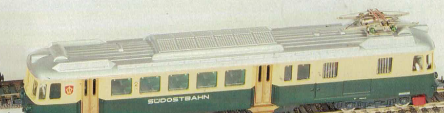
Nr. 252/253 SOB-Pendelzug 3teilig Nr. 447/448 SOB-Personenwagen 2. Klasse Nr. 472/473 SOB-Steuerwagen

Achtung! Ab sofort ist die langersehnte Motorraum-Inneneinrichtung passend zu allen Re 4/4 II und Re 4/4 III der neuen Generation zum nachrüsten lieferbar. Fragen Sie Ihren Fachhändler nach der Artikel-Nr. 165025-50.