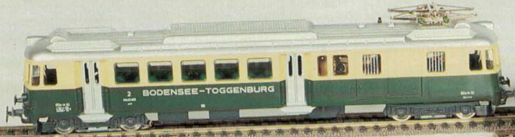
Nr. 190 Wechselstrom Nr. 191 Gleichstrom BT-Triebwagen

Diese Modelle werden nicht mehr neu aufgelegt. Sie sind noch solange lieferbar bis die Lagerbestände an Fertigprodukten oder Halbfabrikaten ausreichen.