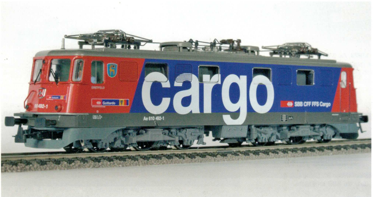
Art. Nr. 11079, Ae640 492-1 Cargo

Nr. 11079, Ae 610492-1 mit Cargo-Lackierung. Nach Ihrer Revision wurde diese Lok als erste Ae 6/6 mit der neuen Cargo Lackierung versehen. Ein anderes äusserliches Merkmal sind die Scheibenwischer, die an den unteren Frontfensterrand verlegt wurden. Die Lok ist während des Jubiläumsjahres zusammen mit 2 Speisewagen auf dem Areal der Autobahnraststätte Erstfeld abgestellt worden. Die Speisewagen dienen als provisorisches Restaurant, da sich das richtige Restaurant im Umbau befindet. Das HAG Modell weist ferner eine neue 3/1 LED Beleuchtung auf.