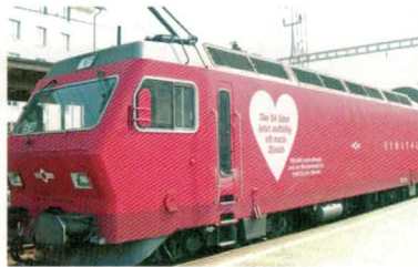
Nr. 26035 , Re 456542-0, Shiltalbahn mit Herz.