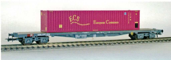
Nr. 72112/113 , SBB Flachwagen Sgs mit 40 ft. Container von ECS.