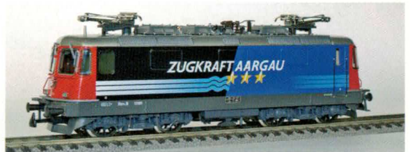
Nr. 16049 , Re 4/4 II, 11181 Aargau gealtert.

Nr. 36013 , Re 10/10 rot mit Re 4/4 II 11253 und Re 6/6 11653 Gümligen. Nr. 36014 , Re 10/10 grün mit Re 4/4 II 11346 und Re 6/6 11688 Linthal. Nr. 36015 , Re 10/10 Cargo mit Re 420268-5 und Re 620061-2 Gampel-Steg.