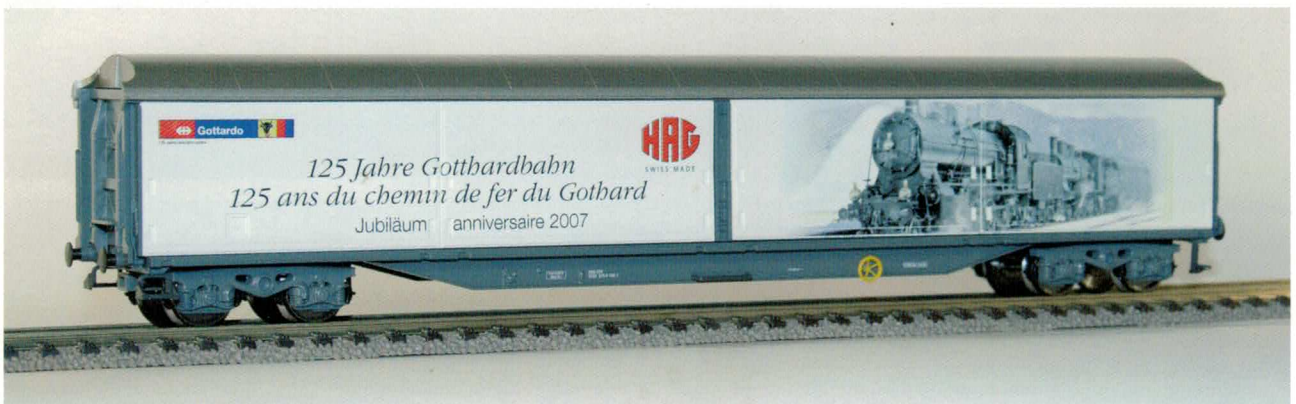
Art. Nr. 74038/39, 4-achsiger, geschlossener Habils Güterwagen mit glatten Seitenwänden. Diese Kreation von HAG ist eine dekorative und preiswerte Erinnerung an das Jubiläumsjahr 2007 „125 Jahre Gotthardbahn“