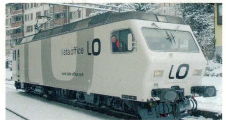
Nr. 26037 , Re 456095-9 Südostbahn mit Werbung für Lista Office.