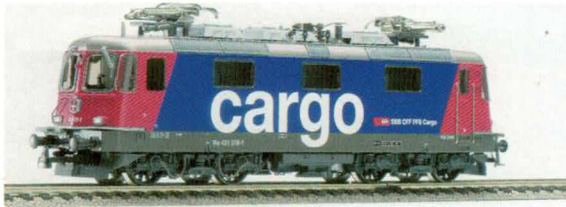
Nr. 16205 , Re 420160-4 Cargo, gealtert.