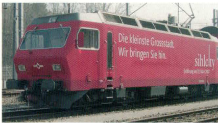
Nr. 26034 , Re 456544-6 Shiltalbahn mit Werbung Sihlcity.