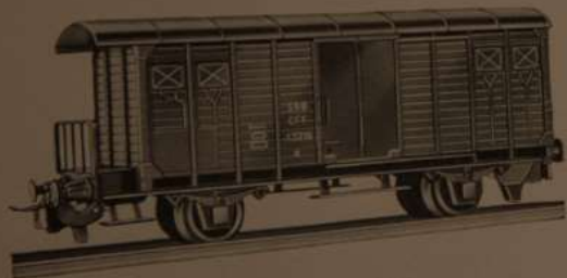
Nr. 340 K 2