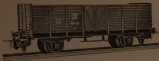
Nr. 330 L 6