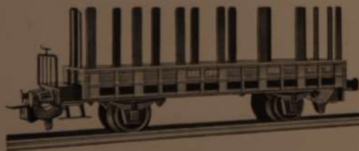
Nr. 325 M 6

Nr. 320 Niederbordwagen mit Geländer, braun oder grau Länge 11,5 cm Wagon ballast avec passerelle, marron ou gris Longueur 11,5 cm Low Sided Gondola with railing, brown or gray Length 4-1/2"