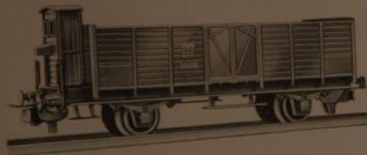
Nr. 335 L 6