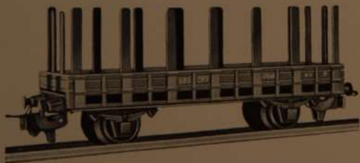
Nr. 310 M 6

Nr. 305 Niederbordwagen mit Bremserhaus, braun oder grau Länge 11,5 cm Wagon ballast avec cabine serre-frein, marron ou gris Longueur 11,5 cm Low Sided Gondola with brakeman's cabin, brown or gray Length 4-1/8"