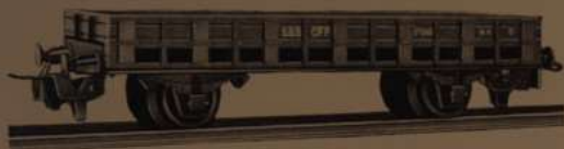
Nr. 300 M 6

Schweizermodelle - unzerbrechliche, solide Zinkspritzgussgehäuse - verschiedene modellmässige Farben (neueste Ausführung) - vollautomatische Kupplung - Wagen können beim Rangieren abgestossen werden - kombinierbar mit sämtlichen bestehenden Marken - Wagenachsen und Räder können bei Gleichstrom ausgetauscht werden - Spitzenlager - feinste Ausführung.