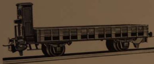
Nr. 305 M 6

Schweizermodelle - unzerbrechliche, solide Zinkspritzgussgehäuse - verschiedene modellmässige Farben (neueste Ausführung) - vollautomatische Kupplung - Wagen können beim Rangieren abgestossen werden - kombinierbar mit sämtlichen bestehenden Marken - Wagenachsen und Räder können bei Gleichstrom ausgetauscht werden - Spitzenlager - feinste Ausführung.