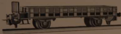
Nr. 320 M 6

Reproduction parfaite des wagons marchandises des Chemins de Fer Fédéraux Suisses en service sur toutes les lignes européennes - Carcasses en zamac injectée sous pressions et incassables - Peinture finement émaillée au four, lettres et inscriptions en relief - Axes en pointes assurant un roulement parfait - Attelages automatiques brevetés permettant le refoulement sur des voies de garage mais pouvant toutefois s'atteler et se dételer automatiquement avec les attelages des marques les plus connues. Axes interchangeables pour fonctionnement en 3 ou 2 rails - Exécution parfaite.