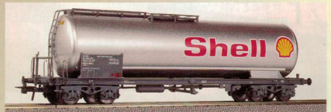
Nr. 382~, Nr. 383= SHELL Kesselwagen «SHELL» Wagon citerne «SHELL»