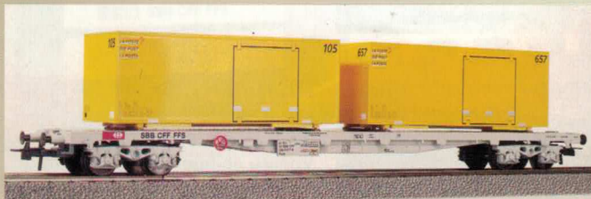
Nr. 600~, Nr. 601= Flachwagen mit Post-Containern Wagon plat avec containers postaux