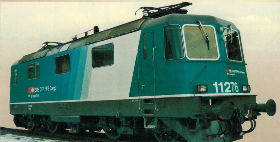
Nr. 246~, Nr. 247 = Re 4/4 II, CARGO

Les voitures de 1ère classe et pilote suivront ultérieurement.