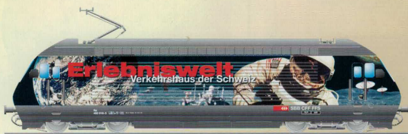
Nr. 280~, Nr. 281= VHS Verkehrshaus der Schweiz Re 460 SBB / CFF / FFS

Bedenken Sie, dass aus Gründen der hohen Lagerhaltungs-Kosten jeweils nur die vorbestellte Menge hergestellt wird! HAG Modelleisenbahnen AG behält sich das Recht vor, die angekündigten Modelle in ihrer Ausführung gegenüber den Abbildungen abgeändert zu liefern oder bei mangelnder Auftragslage nicht zu produzieren. Veuillez prendre en considération qu'en raison des frais élevés de stockage, seule la quantité commandée sera fabriquée! La maison HAG se réserve le droit d'exécuter les modèles annoncés avec quelques modifications; ou de renoncer à la production en cas de commandes insuffisantes.