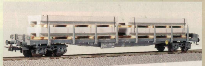
Nr. 350~, Nr. 351= Flachwagen mit Betonplatten Wagon plat chargé de plaques de béton