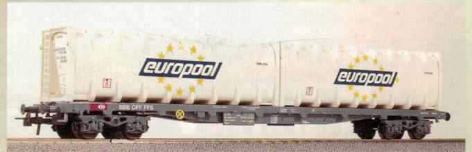
Nr. 356~, Nr. 357= EURO Flachwagen mit Bulkcontainern «Europool» Wagon plat avec containers grand volume «Europool»