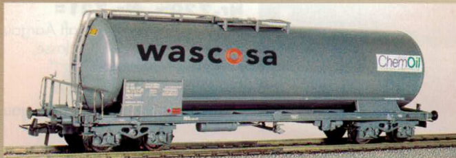
Nr. 382~, Nr. 383= WASCOSA Kesselwagen «Wascosa, ChemOil» Wagon citerne «Wascosa, ChemOil»