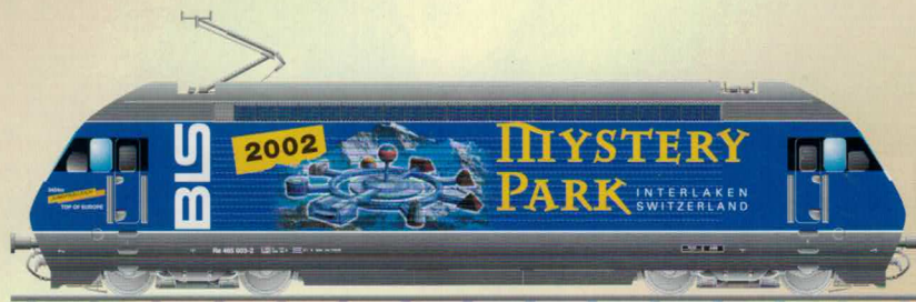
Nr. 184~, Nr. 185= MYSTERY Mystery Park Re 465 BLS