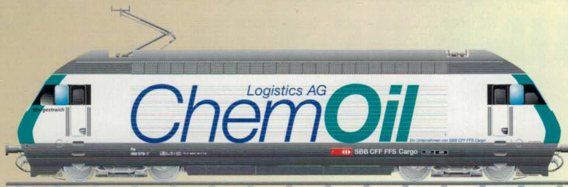
Nr. 280~, Nr. 281= CHEM ChemOil Re 460 SBB / CFF / FFS