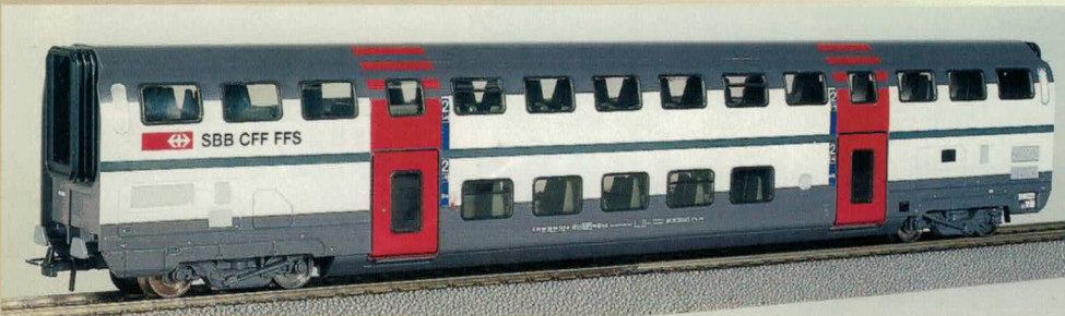
Nr. 490~, Nr. 491 = Doppelstöckiger Reisezugwagen, IC 2000, 2. Klasse Voiture Intercity à deux niveaux, IC 2000, 2ème classe

Die 1. Klassewagen und der Steuerwagen folgen später.