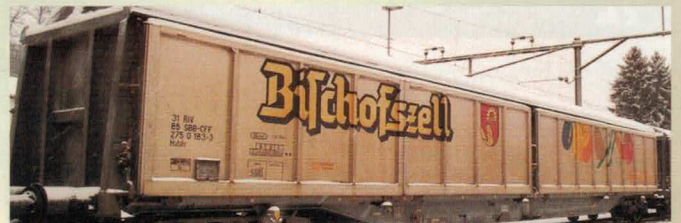
Nr. 358~, Nr. 359= BISCH Habils «Bischofszell» Wagon couvert, Habils, parois lisses: «Bischofszell» Nr. 384~, Nr. 385= BISCH Habils «Bischofszell» Wagon couvert, Habils, parois nervurées: «Bischofszell»