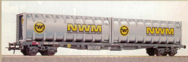
Nr. 356~, Nr. 357= NWM Flachwagen mit Bulkcontainern «NWM» Wagon plat avec containers grand volume «NWM»