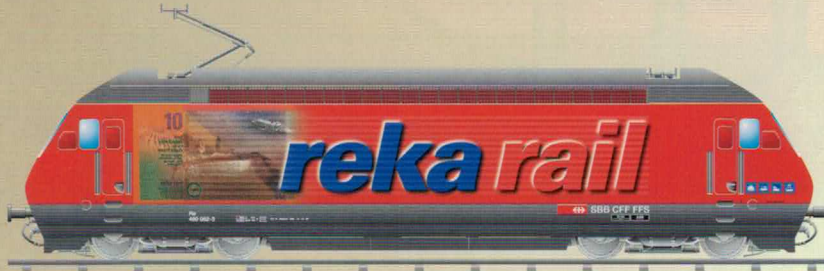
Nr. 280~, Nr. 281= REKA RekaRail Re 460 SBB / CFF / FFS