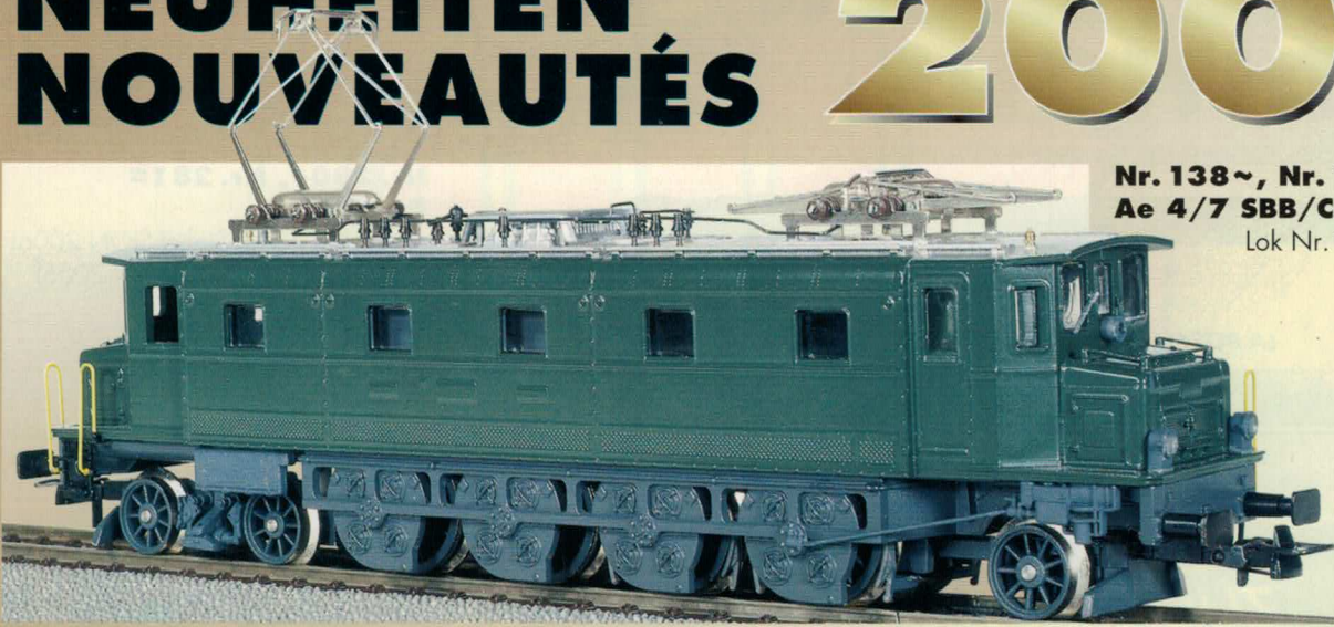
Nr. 138~, Nr. 139 = Ae 4/7 SBB/CFF/FFS Lok Nr. 10905