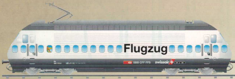
Nr. 280~, Nr. 281= FLUG Flugzug Re 460 SBB / CFF / FFS