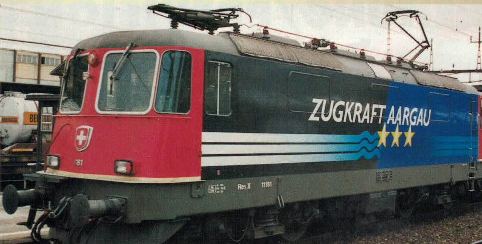
Nr. 165~, Nr. 166 = AARGAU Re 4/4 II, «ZUGKRAFT AARGAU»