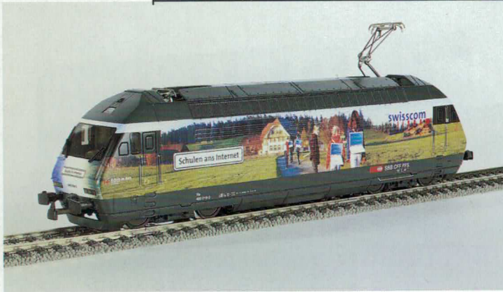
Art. Nr. 280~/281= Swisscom Re 460 SBB, mit Werbung für Swisscom Re 460 CFF publicitaire Swisscom