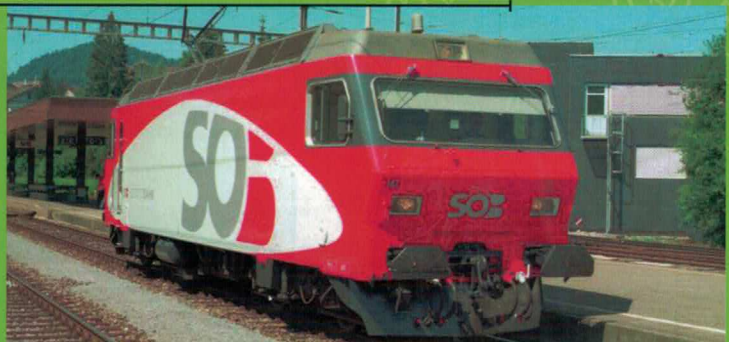
Art. Nr. 262~/263= Re 456 SOB, mit der neuen Südostbahn-Lackierung Re 456 SOB nouvelle livrée et logo SOB