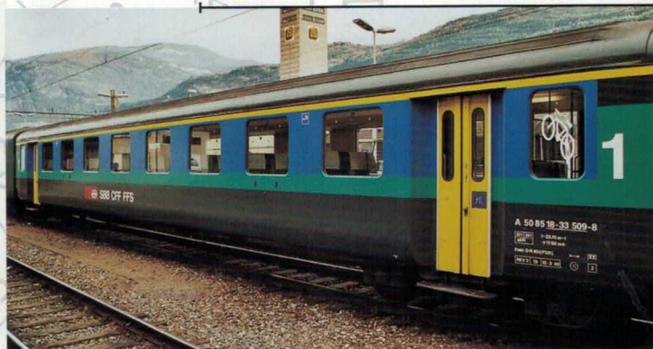
Art. Nr. 748~/749= EW1 Personenwagen SBB, 1. Klasse Regio Voiture unifiée 1, 1ère classe CFF aux coloris «Regio»