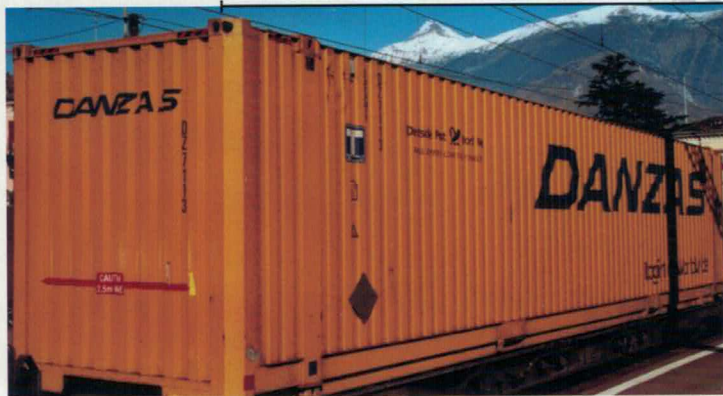
Art. Nr. 612~/613= Danzas Flachwagen Sgiss mit 40 ft Container von Danzas. Wagon plat Sgiss, chargé d'un container «Danzas» de 40 ft.