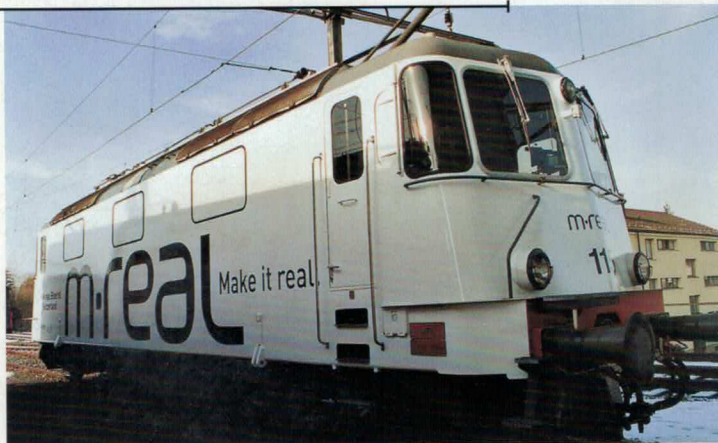
Art. Nr. 194~/195= m.real Re 4/4 III RM, mit Werbung für m-real Biberist Re 4/4 III RM publicitaire m-real Biberist