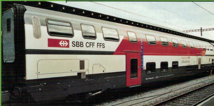
Art. Nr. 708~/709= IC 2000 Speisewagen «elvetino» IC 2000 voiture restaurant «elvetino»