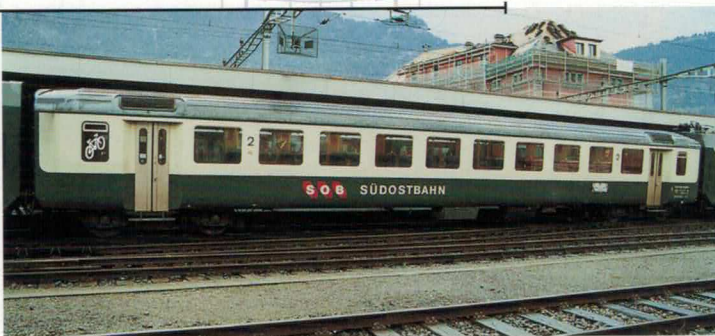
Art. Nr. 726~/727= EW1 SOB 2. Klasse mit der alten Lackierung Voiture unifiée 1, 2ème classe SOB aux anciennes couleurs