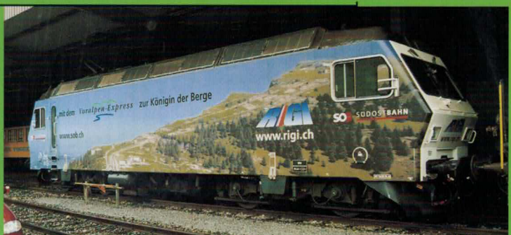
Art. Nr. 262~/263= Rigi Re 456 SOB, mit Werbung für den Rigi und das Toggenburg Re 456 SOB publicitaire pour le Rigi et la région du Toggenburg