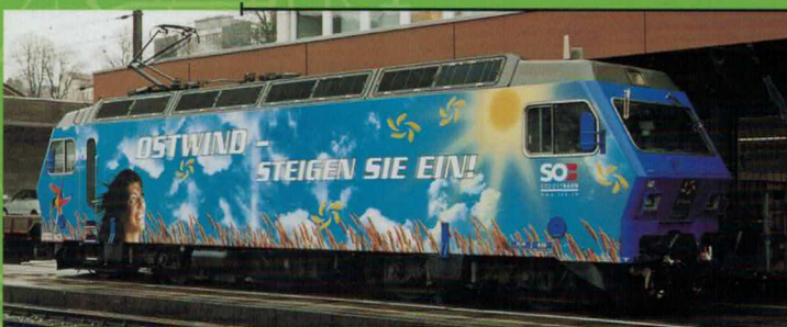
Art. Nr. 262~/263= Ostwind Re 456 SOB, mit Werbung für den Regionalverbund Ostschweiz Re 456 SOB publicitaire pour communauté tarifaire de la suisse orientale