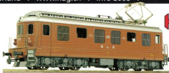
18 041 : BLS Ae 4/4 braun, Lok Nr. 253