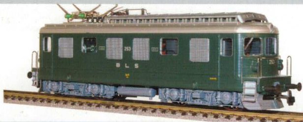
18 040 : BLS Ae 4/4 grün, Lok Nr. 252