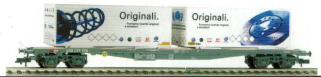
73 014 ~ AC, 73 015 = DC SBB Flachwagen für Container Typ Sgs, mit 2 x 25 ft. WB Container von AMAG.