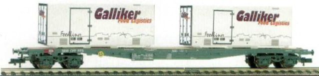
73 012 ~ AC, 73 013 = DC SBB Flachwagen für Container Typ Sgs, mit 2 x WB Container von Galliker.