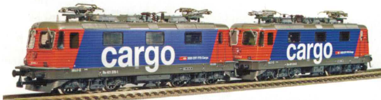
36 018 : SBB Doppeltraktion Cargo Re 421, Lok Nr. 421393-0 Cargo und Re 421, Lok Nr. 421376-5 Cargo