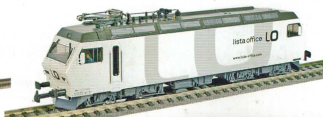
26 037 : Re 456 SOB, Lista Office, Lok Nr. 456095-9