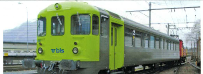
58 008 ~ AC, 58 009 = DC BLS Steuerwagen für Autozüge, neue grün/graue bls-Lackierung.