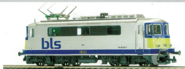
16 043 : BLS Re 420 silber, Lok Nr. 420504-3