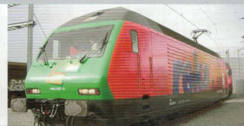
28 216 : SBB Re 460087-0 „REKA Rail II“