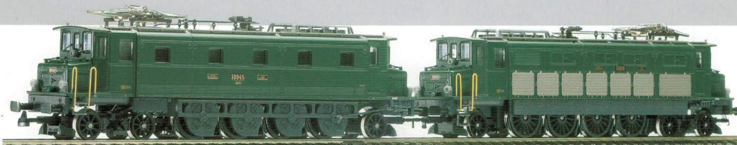
36 016 : Ae 4/7 Doppeltraktion Ae 4/7 Sécheron mit 5 Lüfter, Lok Nr. 10946 Ae 4/7 Sécheron mit 7 Lüfter, Lok Nr. 11010 Beide mit Einholm Stromabnehmer