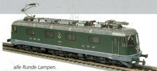
alle Runde Lampen.