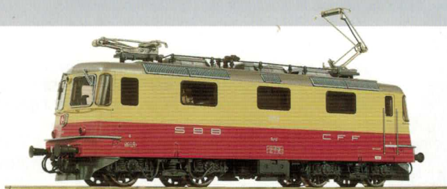
16 009 : SBB Re 4/4'' TEE, Lok Nr. 11159 Runde Lampen.