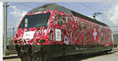
28 212 : SBB Re 460044-1 „Euro 08“