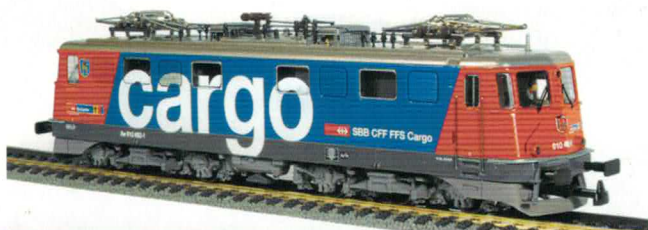
11 079 : Ae 6/6 Cargo, Erstfeld, Lok Nr. 610 492-1 (Gotthard Jubiläum) 11 082 : Ae 6/6 Cargo, Burgdorf, Lok Nr. 610 486-3 11 032 : Ae 6/6 Cargo, Appenzell, Lok Nr. 610 420-2 (ex Kantonslok)