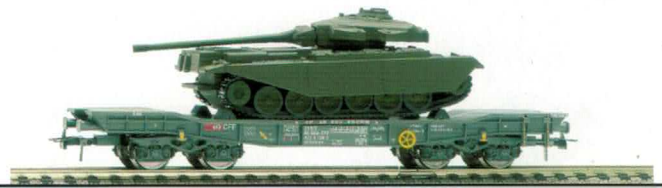
78 004 ~ AC, 78 005 = DC SBB Tiefladewagen Typ Slmmnps, mit Centurion Panzer.