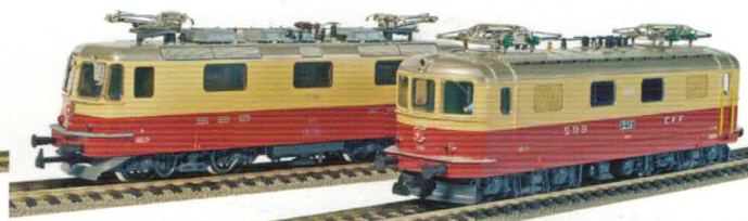
27 003 : Lokpackung TEE Jubiläum bestehend aus: Re 4/4' TEE Lok Nr.10050 und Re 4/4" Lok Nr. 11161