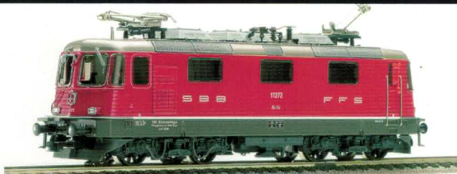
16 041 : SBB Re 4/4 II rot, «100ste Klimaanlage» Lok Nr. 11272 16 200 : SBB Re 4/4 II rot, Klima, Lok Nr. 11356 16 201 : SBB Re 4/4 II rot, Klima, Lok Nr. 11356 gealtert