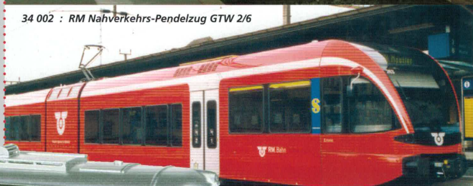
34 002 : RM Nahverkehrs-Pendelzug GTW 2/6