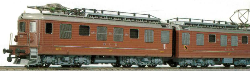
24 022 : BLS Ae 8/8 braun, Lok Nr. 271, 4-motorig, gealtert