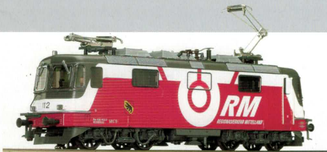
16 025 : RM Re 4/4 III Thun, Lok Nr. 436113-5