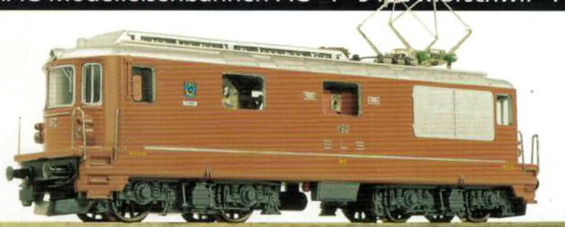
18 012 : BLS Re 4/4 Kandergrund, Lok Nr. 182 18 014 : BLS Re 4/4 Reichenbach, Lok Nr. 191 mit Einholmbügel