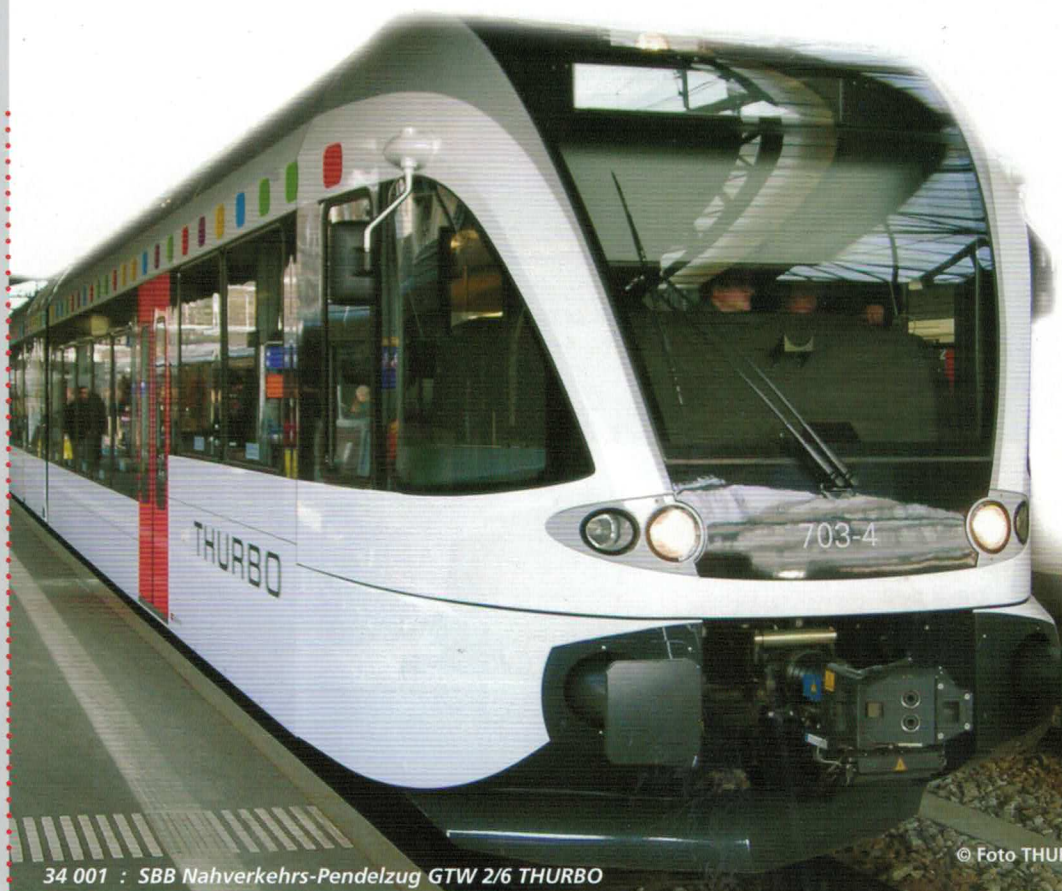
34 001 : SBB Nahverkehrs-Pendelzug GTW 2/6 THURBO