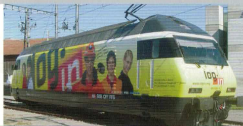
28 211 : SBB Re 460053-2 „LOGIN“