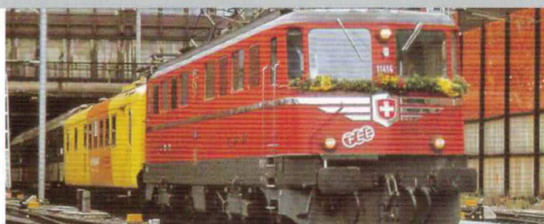
11 033 : Ae 6/6 Kantonslok rot, Bern, FEE, Lok Nr. 11414 FEE-Aufschrift zu Ehren des Lokführers Franz Eberhard, Express. Seine letzte Fahrt am 25. September 1999.