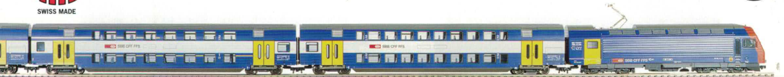
31 007 : S-Bahn Zug mit Lok Nr. 450048-4 , Elgg 31 008 : S-Bahn Zug mit Lok Nr. 450048-8 , Bonstetten, blaue Gepäcktüre Zugpackung mit 1 Lok, 2 Reisewagen, 1 Steuerwagen.