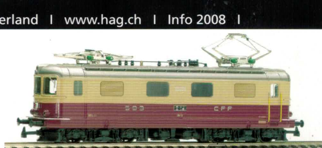
22 011 : SBB Re 4/4' TEE+, Lok Nr. 10034