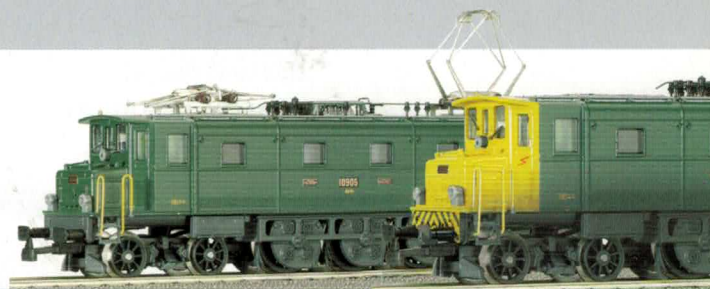
13 009 : Ae 4/7 Mittel-Thurgau-Bahn, Lok Nr. 11018 13 015 : Ae 4/7 SBB, Lok Nr. 10915