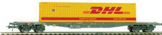
72 106 ~ AC, 72 107 = DC SBB Flachwagen für Container Typ Sgs, mit 40 ft. Überseecontainer von DHL.