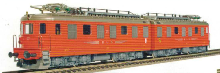
24 023 : BLS Ae 8/8 rot, Lok Nr. 271, 4-motorig