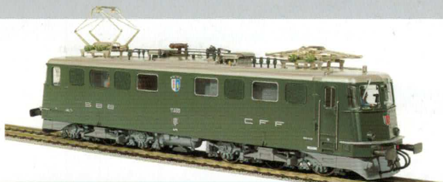
11 085 : Ae 6/6 Städtelok grün, Le Locle, Lok Nr. 11504 11 087 : Ae 6/6 Städtelok grün, Bellinzona, Lok Nr. 11446