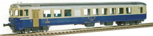
58 000 ~ AC, 58 001 = DC BLS Steuerwagen BDt mit Motorrad-Abteil, alte Beschriftung. 58 006 ~ AC, 58 007 = DC BLS Steuerwagen für Autozüge, blau/ crème, neuer BLS Beschriftung.