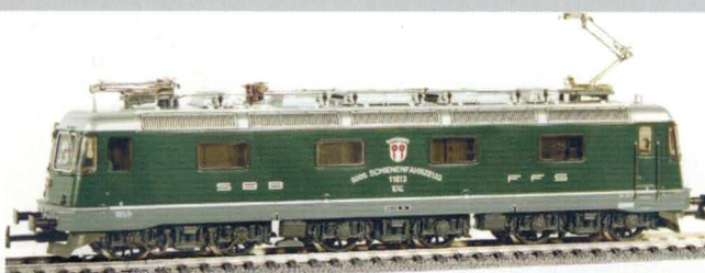
20 008 : Re 6/6 grün, Rapperswil, Lok Nr. 11613 Bogenschrift Aufschrift «5000. Schienenfahrzeug» 20 012 : Re 6/6 grün, Rapperswil, Lok Nr. 11613 kleine Aufschrift 20 503 : Re 6/6 grün, Rapperswil, Lok Nr. 11613 gealtert