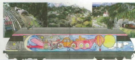
28 214 : SBB Re 460200-9 VHS Wettbewerb 07 Das Verkehrshaus der Schweiz hat 2007 wieder einen Wettbewerb lanciert. Dies ist das Gewinner-Sujet von Silvia Arnold aus Hochdorf.