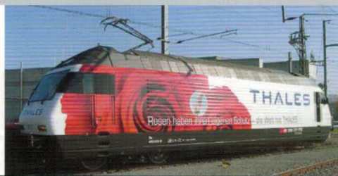
28 215 : SBB Re 460012-8 „THALES“