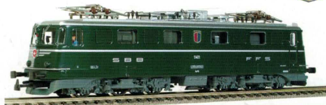
11 020 : Ae 6/6 Kantonslok grün, Tessin, Lok Nr. 11401 Erste Ae 6/6 11 021 : Ae 6/6 Kantonslok grün, Uri, Lok Nr. 11402 (Zweite Ae 6/6) 11 034 : Ae 6/6 Kantonslok grün, Bern, Lok Nr. 11414