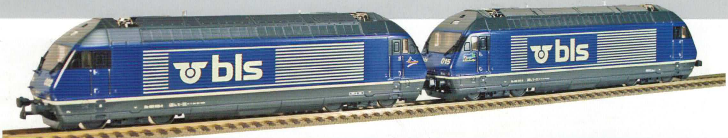
36 019 : BLS Doppeltraktion, blau Re 465 BLS, Lötschental, Lok Nr. 465006-5 und Re 465 BLS, Schratzenflue, Lok Nr. 465017-2