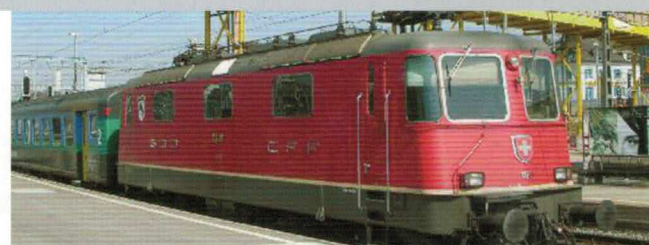
16 206 : SBB Re 4/4 II mit Wappen «Porrentury», und Klimaanlage, Lok Nr. 11239