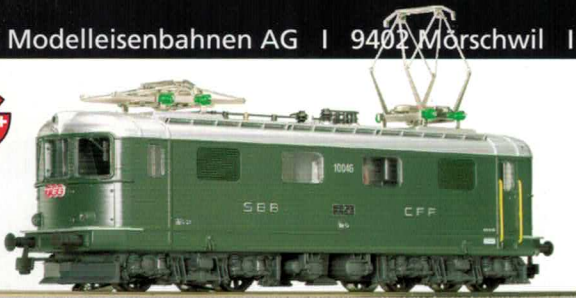
22 012 : SBB Re 4/4' TEE grün, Lok Nr. 10046