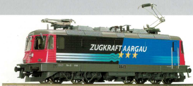
16 038 : SBB Re 4/4 II Zugkraft Aargau, Lok Nr. 11181 16 049 : SBB Re 4/4 II Zugkraft Aargau, Lok Nr. 11181 gealtert