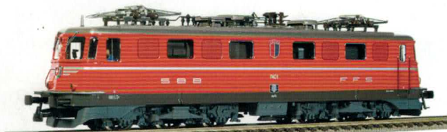
11 024 : Ae 6/6 Kantonslok rot, Tessin, Lok Nr. 11401 (Erste Ae 6/6)* 11 027 : Ae 6/6 Kantonslok rot, Uri, Lok Nr. 11402 (Zweite Ae 6/6)** 11 028 : Ae 6/6 Kantonslok rot, Tessin, Lok Nr. 11401** *mit IC-Treppe, **ohne IC-Treppe