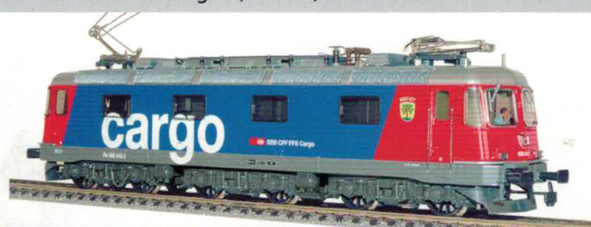
20 031 : Re 6/6 Cargo, Muri AG, Lok Nr. 620033-1 2 Motoren.