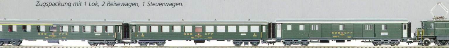
25 002 : Zugpackung SBB Nostalgiezug bestehend aus: Ae 4/7 mit zwei schweren Reisewagen und einem Gepäckwagen.