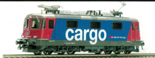
16 042 : Re 420 Cargo blau-rot, Lok Nr. 420160-4 16 205 : Re 420 Cargo blau-rot, Lok Nr. 420160-4 gealtert Mit Klimaanlage.