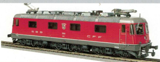
20 502 : Re 6/6 rot, Cham, Lok Nr. 11673, Runde Lampen.