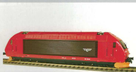
28 163 : Norwegische EL 18 2245