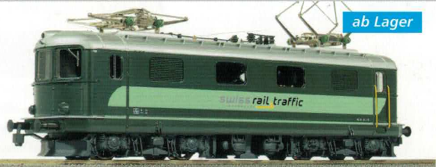
22 018 : Swiss Rail Traffic Re 416 628-6 (Re 4/4')