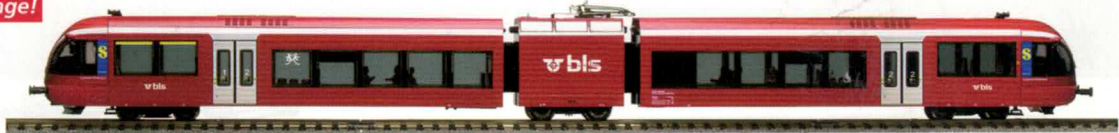
34 008 : BLS Pendelzug GTW 2/6, rot, Nr. 526 265-4, Wankdorf