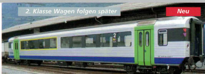
52 032 ~ AC, 52 033 = DC BLS EW 1, AB, 1./2. Klasse, mit Nina-Lackierung