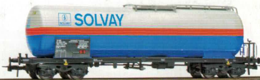
76 022 ~ AC, 76 023 = DC Belgische Staatsbahnen, Kesselwagen «SOLVAY»