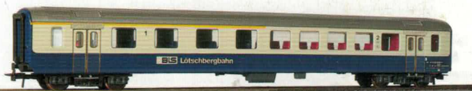
52 028 ~ AC, 52 029 = DC BLS EW 1, AB, 1./2. Klasse mit Schwingtüren