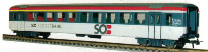
53 008 ~ AC, 53 009 = DC SOB EW 1, AB, 1./2. Klasse, Südostbahn

Solche geliehenen Doppelstöcker hat die BLS auf der S-1-Strecke Bern-Spiez als S-Bahn-Shuttle anno 2008 eingesetzt. von «Hobby Trade»