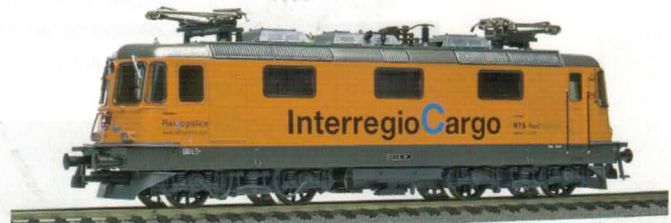
16 219 : Interregio Cargo, Re 4/4'' «RTS Rail Traction», Lok Nr. 11320, Lampen rechteckig