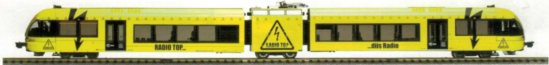
34 009 : SBB Pendelzug GTW 2/6 Turbo «Top-Blitz»