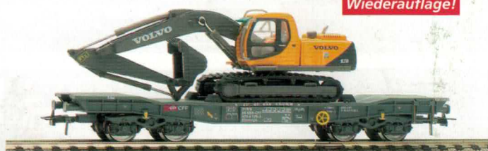
78 002 ~ AC, 78 003 = DC SBB Tiefladewagen mit Schaufelbagger 78 000 ~ AC, 78 001 = DC SBB Tiefladewagen, ohne Ladung