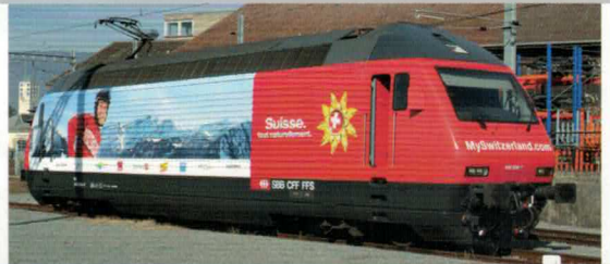
28 250 : SBB Re 460, «My Switzerland», Lok Nr. 460036-7