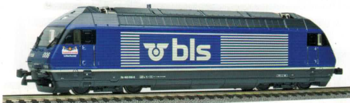
28 536 : BLS Re 465, Niesen, Lok Nr. 465005-7 28 537 : BLS Re 465, Jungfrauoch, Lok Nr. 465003-2 28 519 : BLS Re 465, Lötschental, Lok Nr. 465006-5