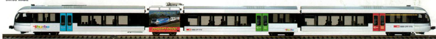
34 103 : SBB Pendelzug GTW 2/8 Thurbo, 4-teilig mit Werbung für «Zugkraft Stucki»