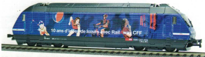
28 248 : SBB Re 460, «Rail Away II», Lok Nr. 460050-8