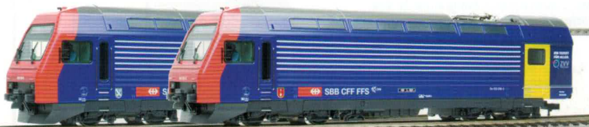
30 023 : SBB Re 450 der S-Bahn Zürich, Feldbach, Lok Nr. 450 045-0, blaue Gepäcktüre und ZVV Signet 30 016 : SBB Re 450 der S-Bahn Zürich, Winterthur-Veltheim, Lok Nr. 450 096-3, gelbe Gepäcktüre und ZVV Signet