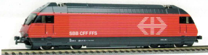
28 016 : SBB Re 460, Üetliberg, Lok Nr. 460004-5 28 014 : SBB Re 460, Wiggertal, Lok Nr. 460061-5