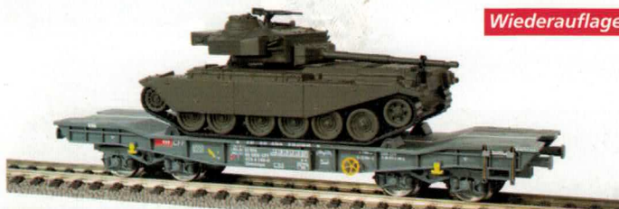
78 004 ~ AC, 78 005 = DC SBB Tiefladewagen mit Centurion Panzer