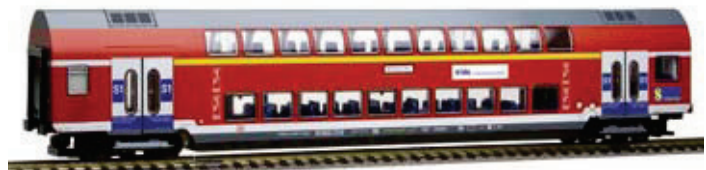
63 100 ~ AC, 63 101 = DC, Doppelstock-Wagen BLS, 1. Klasse Nr. 50 80 36-81 097-8 von «Hobby Trade»