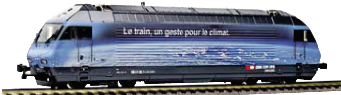
28 236 : SBB Re 460, «Fürs Klima die Bahn», Lok Nr. 460002-9