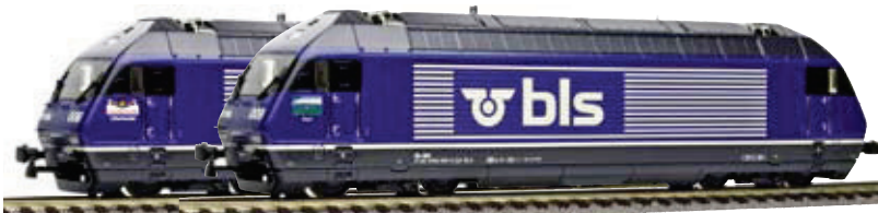
28 519 : BLS Re 465, Lötschental, Lok Nr. 465006-5 28 532 : BLS Re 465, Napf, Lok Nr. 465009-9