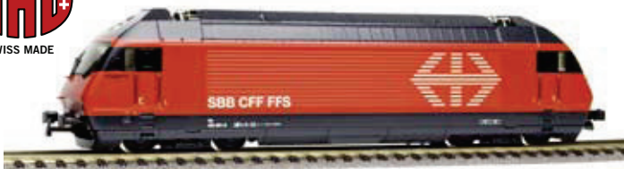
28 011 : SBB Re 460, Pilatus, Lok Nr. 460085-4 28 014 : SBB Re 460, Wiggertal, Lok Nr. 460061-5