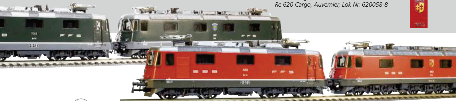
36 022 : SBB Re 10/10, grün Re 4/4 II , grün, Lok Nr. 11344, mit Klimaanlage und Re 6/6, grün, Heerbrugg, Lok Nr. 11617