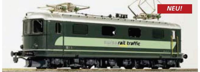
22 018 : Swiss Rail Traffic Re 416 628-6 (Re 4/4')