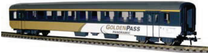
52 020 ~ AC, 52 021 = DC BLS EW 1, A, 1. Klasse, Golden Pass Line