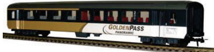
52 022 ~ AC, 52 023 = DC BLS EW 1, AB, 1./2. Klasse, Golden Pass Line