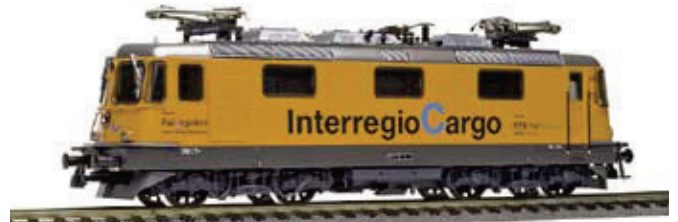
16 219 : Interregio Cargo, Re 4/4', «RTS Rail Traction», Lok Nr. 11320, Lampen rechteckig