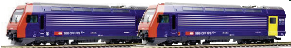
30 023 : SBB Re 450 der S-Bahn Zürich, Feldbach, Lok Nr. 450 045-0, blaue Gepäcktüre und ZVV Signet