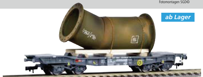
78 030 ~ AC, 78 031 = DC SBB Tiefladewagen Typ SImnmps, mit abgewinkeltem Rohr (ersetzt die ursprüngliche Artikel Nr. 78 006 und 78 007)