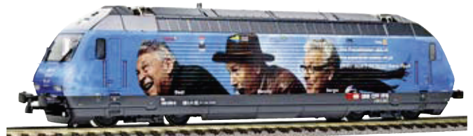
28 237 : SBB Re 460, «Ihre Freizeit Tester», Lok Nr. 460076-3