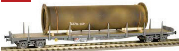
70 058 ~ AC, 70 059 = DC SBB Flachwagen mit Klappungen Typ Rs, mit grosser Röhre