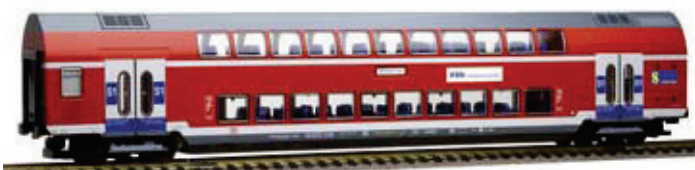
63 102 ~ AC, 63 103 = DC, Doppelstock-Wagen BLS, 2. Klasse Nr. 50 80 26-81 236-4 von «Hobby Trade» 63 104 ~ AC, 63 105 = DC, Nr. 50 80 26-81 235-6 63 106 ~ AC, 63 107 = DC, Nr. 50 80 26-81 245-5 63 108 ~ AC, 63 109 = DC, Nr. 50 80 26-81 244-8

Diese Wagen sind alle ab Werk mit Innenbeleuchtung ausgerüstet !