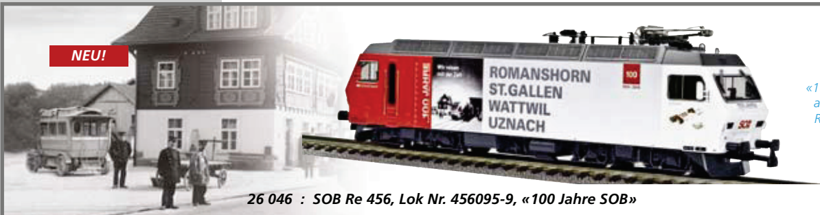
26 046 : SOB Re 456, Lok Nr. 456095-9, «100 Jahre SOB»