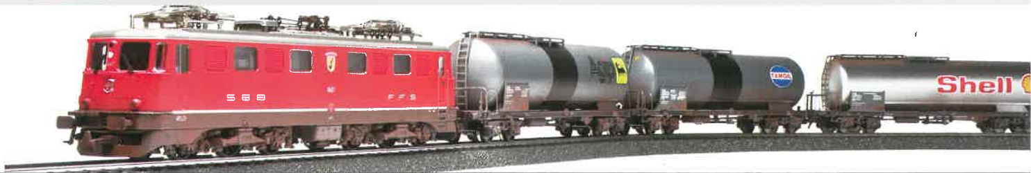
25 012 : Oelzug mit Ae 6/6 Städtelok rot, gealtert (div. Wappen) und 4 Kesselwagen gealtert.