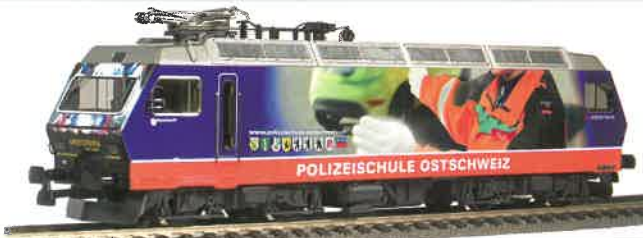
26 042 : SOB Re 456, Lok Nr. 456092-6 Mit Werbung für die Polizeischule Ostschweiz