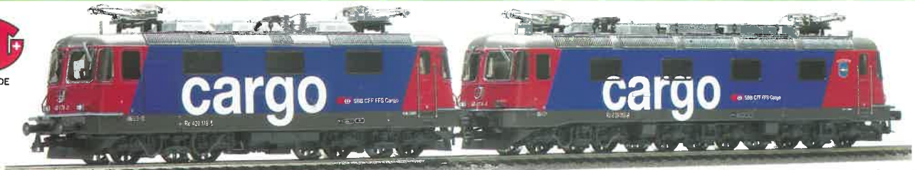
36 023 : SBB Re 10/10 Cargo NEU! Re 420 Cargo, Lok Nr. 420178-6 Re 620 Cargo, Auvernier, Lok Nr. 620058-8