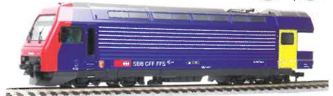
30 010 : Re 450 der S-Bahn Zürich, Zürich-Affoltern, Lok Nr. 450 046-8 30 022 : Re 450 der S-Bahn Zürich, Wien, Lok Nr. 450 050-0 Beide gelbe Gepäcktüre