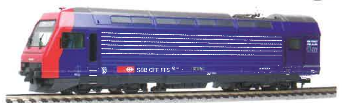
30 023 : Re 450 der S-Bahn Zürich, Feldbach, Lok Nr. 450 045-0 Blaue Gepäcktüre und ZVV Signet