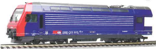
30 014 : Re 450 der S-Bahn Zürich, Bonstetten, Lok Nr. 450 065-8 Blaue Gepäcktüre