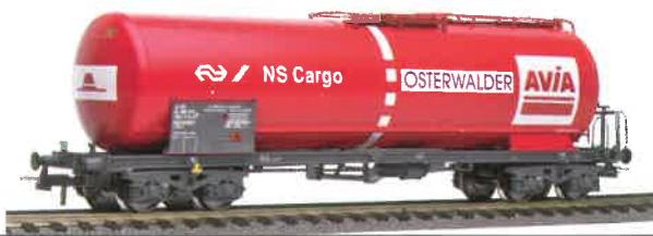
76 018 ~ AC/76 019= DC SBB Kesselwagen 4-achsig, Typ Uahs, AVIA Osterwalder NS Cargo mit rotem Tank.