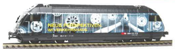
28 011 : Re 460 SBB, Pilatus, Lok Nr. 460085-4 28 014 : Re 460 SBB, Wiggertal, Lok Nr. 460061-5