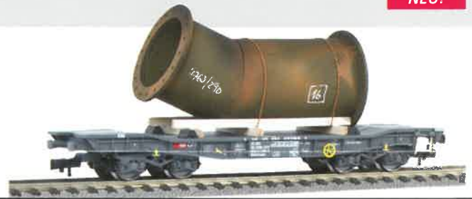
70 058 ~ AC, 70 059 = DC SBB Flachwagen mit Klappungen Typ Rs, mit grosser Röhre.