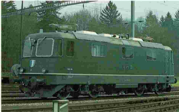
Re 4/4" VHB Vereinigte Huttwil-Bahnen