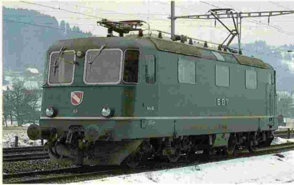
Re 4/4" EBT Emmenthal-Burgdorf-Thun-Bahn