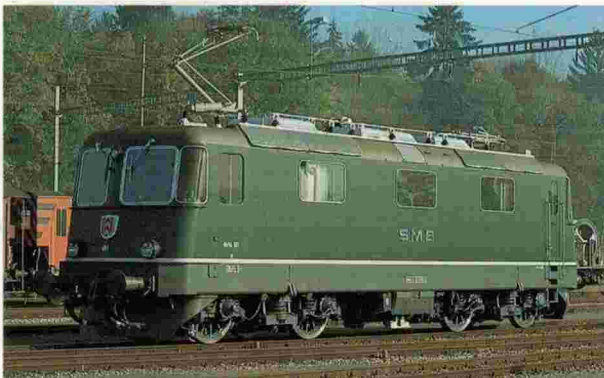
Re 4/4" SMB Solothurn-Münster-Bahn